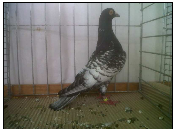
Meilleure femelle à David CURE (96 pts)