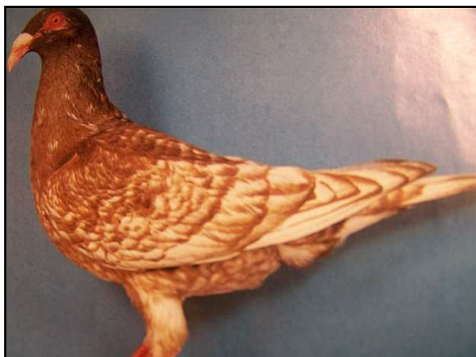
Pigeon Espagnol cousin de notre TNB