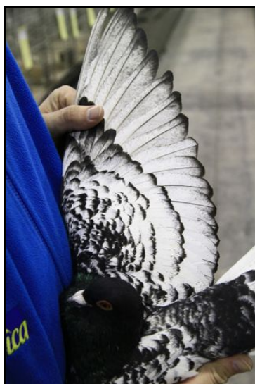
Le Super Champion 2011