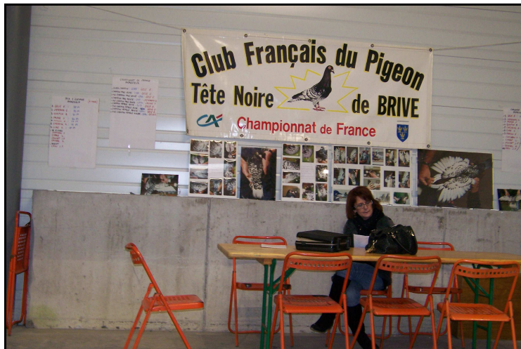
Stand du club à Andrézieux