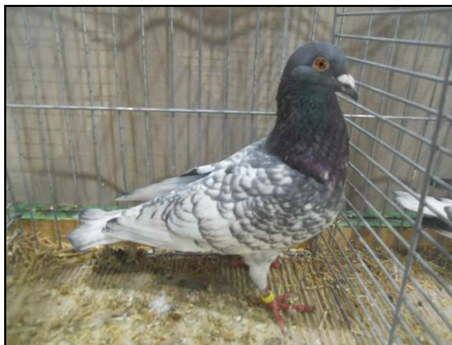
Tête Colorée de Brive Bleu présenté à Leipzig en Allemagne