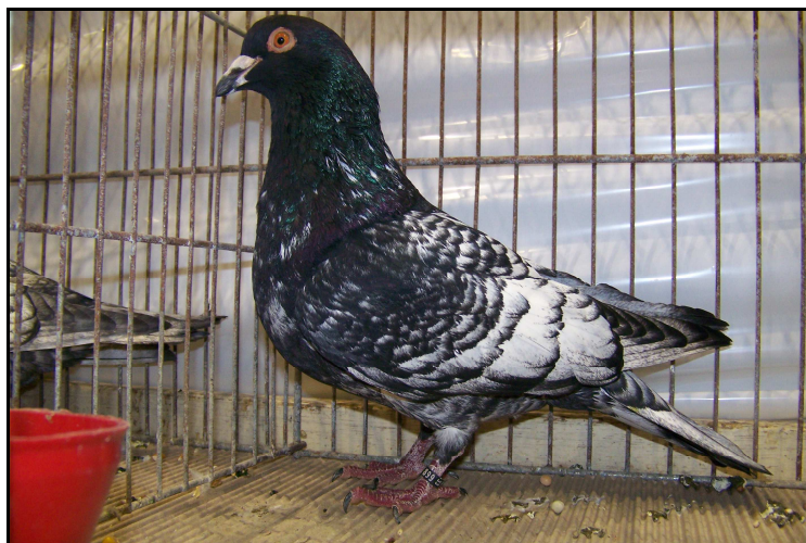
Vice Champion de France mâle adulte à Yves VALADE