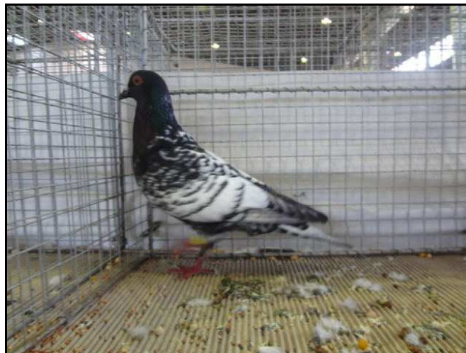
Limoges sujet à Gilbert LASTERNAS (96 pts)