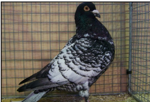
Vice championne de France femelle adulte à Gilbert LASTERNAS

Ces tableaux vont vous permettre de faire une comparaison sur l'évolution de nos champions entre le championnat de France 2009 de Montluçon et le championnat de France Niort 2010. Je rappelle une nouvelle fois que le standard de notre protégé est de 38 à 41 cm de la pointe du bec à la pointe de la queue et faire un poids maximum de 650g. Pour la taille, même chose que l'an passé. Nous avons mesuré de deux manières différentes: de la pointe du bec à celle de la queue (sans non plus tirer sur le sujet) et de la pointe du pommeau à celle de la queue. Pour le poids, une petite balance avec un bocal nous a suffi.