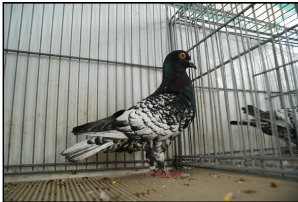
Championne régionale nord à Jean-Pierre CAHU (GPH 96pts)