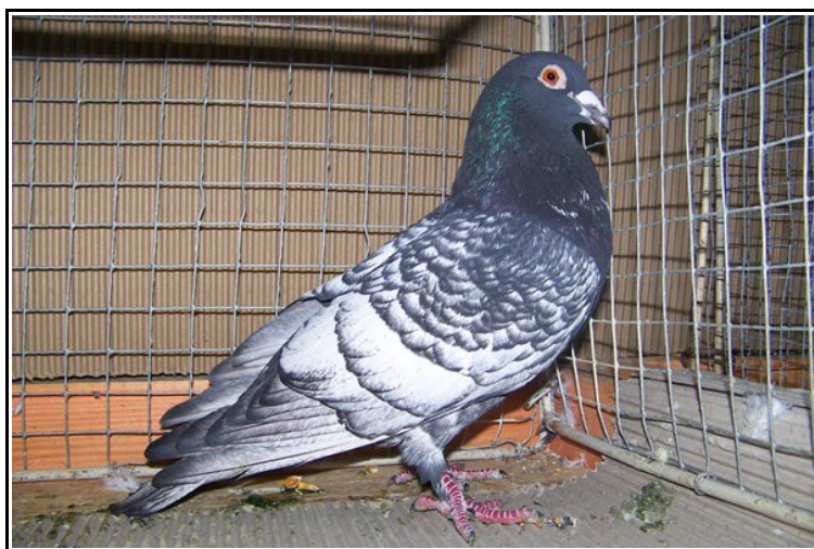
Champion de France mâle adulte à René EVAIN