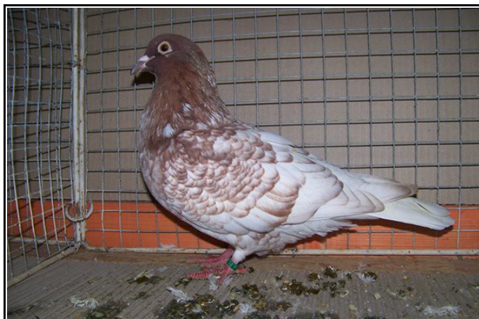
TCB rouge à Emmanuel GELE (92 pts)