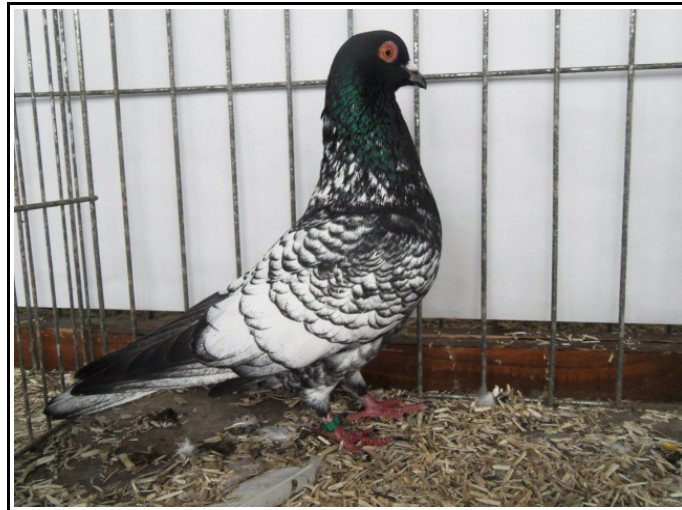
Waldweistroff femelle TCBN à Simon ROUPPERT (96 pts)