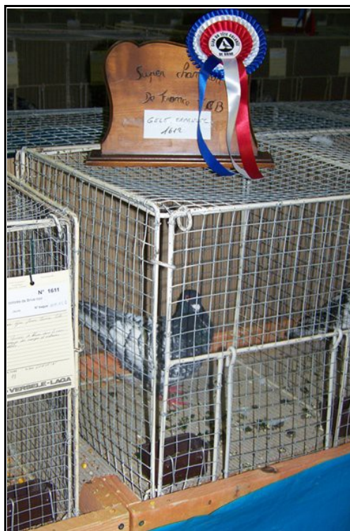
Super Champion de France