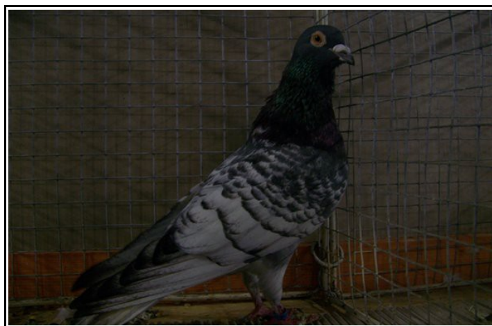
TCB bleu à Bernard GLOUTON (95 pts)